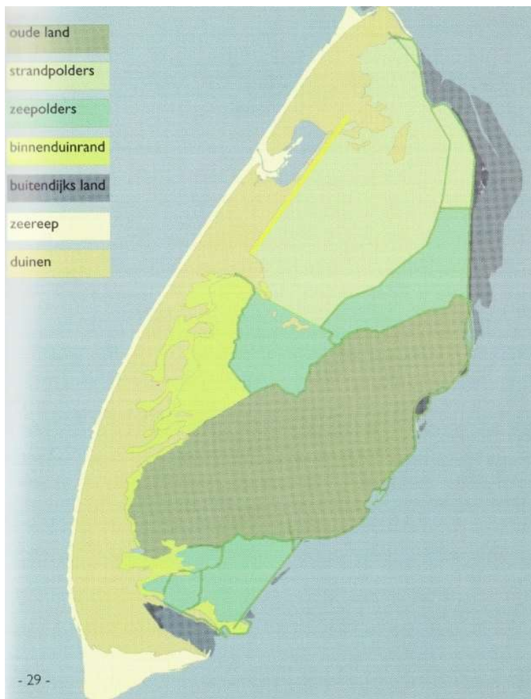
Fig. 1: De zeven verschillende landschapstypen uit het gemeentelijke Beeldkwaliteitsplan buitengebied. Kaart overgenomen uit "Texel in Beeld" (2007, pag. 30).

Binnenduinrand (o.a. De Naal, Zouteland, gebied tussen Rozendijk en het begin van de Zanddijk tussen de oude eilanden Texel en Eierland, zanddijk. Beval ook grootste deel van De Dennen)